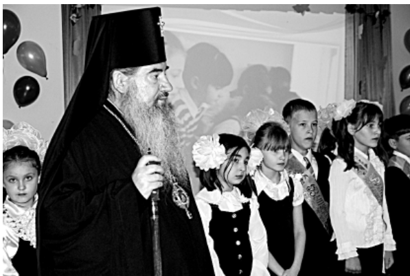
По сообщениям корреспондентов «ПО».