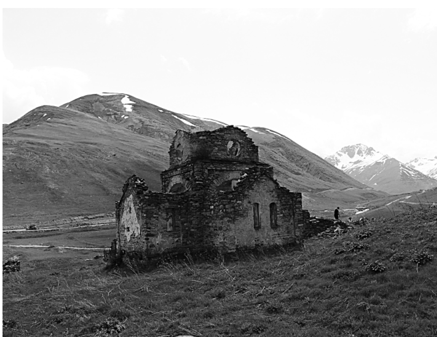
Старинный храм в селении Лисри

«Высшей наградой является возвращение в изначальное божественное состояние – возвращение в «Свет», о чем свидетельствует исконное осетинское (в отличие от заимствованных из мировых