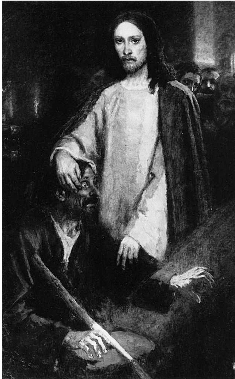
«Исцеление слепорожденного». В.И. Суриков.

ВОСПОМИНАНИЕ И МЕТАФОРА. Евангельские повествования и в большей степени – Четвертое Евангелие сочетают в себе воспоминание и метафору, это исто-