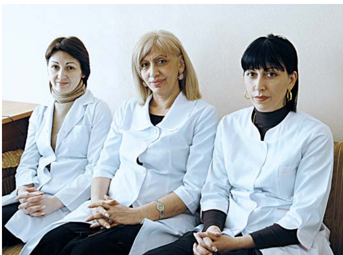
Имея такого наставника, никакой диагноз не страшен